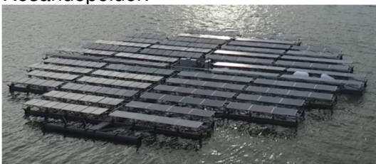
Voorbeeld van een zonnevlot

Het plan is om een drijvend zonneparkje te bouwen: een vlot van ongeveer 4 bij 6 meter waarop zonnepanelen zijn bevestigd. Dit vlot kunnen bewoners om de beurt lenen en hun huishouden erop 'inprikken'. Hiermee kun je oefenen met zonnepanelen en kijken wat de opbrengst is op jouw locatie. Het idee is om klein te beginnen, dus met enkele zonnepanelen, zodat het realiseren van het vlot haalbaar is en het niet te ingewikkeld wordt. De kosten voor het gebruik van de opgewekte elektriciteit zijn 5 ct/kWh (in plaats van de kosten van een energieleverancier ongeveer 20 ct/kWh). Dit geld wordt dan gebruikt voor het bekostigen van het vlot en eventuele andere toekomstige duurzame installaties in de Rosandepolder.